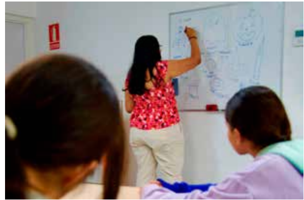
Sena Segbefia Voluntaria de Actividades de Inglés

"Ha sido una experiencia maravillosa poder enseñar a estos niños y niñas inglés. Y estoy encantada de poder continuar mi voluntariado en la Fundación "